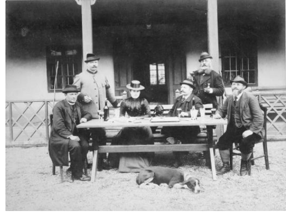
Idylle beim Forsthaus in Feistritzwald (Fam.-Archiv Heimo Stadlbauer)

Die Waldbahn Frauenwald brachte Arbeit ins abseits der Semmeringbahn gelegene obere Feistritztal und bildete ca. 55 Jahre lang eine wichtige Lebensgrundlage für die dort lebende Bevölkerung. Auch das obere Fröschnitztal profitierte von ihrem Betrieb. Daher soll das Andenken an diese Bahn weiterhin gewahrt bleiben.