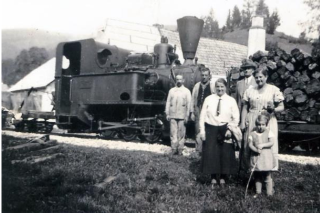
BMMF-Lok (Baujahr 1918), Feistritztal