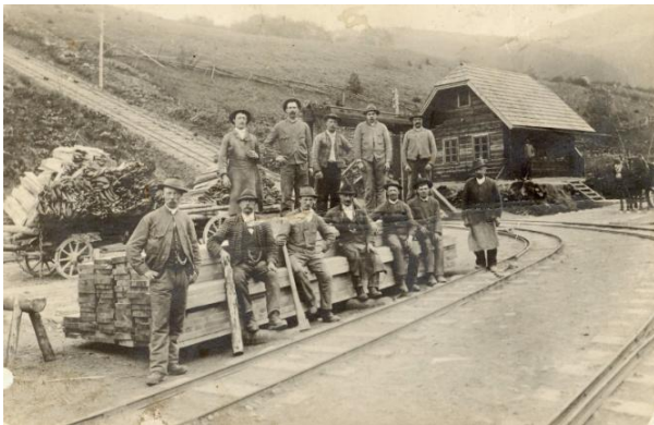
Bremsberg-Talstation, Fröschnitztal

Am Ende der ca. 2,9 km langen Sattelstrecke (ein Abschnitt dieser ehemaligen Trasse ist heute übrigens ein Teil des Wanderweges zwischen dem Feistritzsattel und dem Sonnwendstein) wurden die Waggons über einen Bremsberg mit etwa 821 m Länge ins ca. 234 m tiefer gelegene Fröschnitztal transportiert.