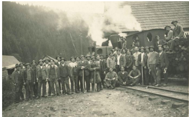
Mitarbeiter beim Forstgut Frauenwald

Von dort wurde das Holz talabwärts zum Bahnhof Steinhaus am Semmering befördert und verladen. Die im Jahr 1930 zwangsweise Abtragung von fast 2,5 km der Strecke im Feistritztal und beim Feistritztalaufzug verursachte für viele Arbeiter in Feistritzwald große finanzielle Probleme. Nachdem einige Zeit später aber die Gleislücke wieder geschlossen werden konnte, wurde für die Waldbahn gegen Ende des Jahres 1934 sogar ein beschränkt-öffentlicher Güterverkehr bewilligt. Entlang der Waldbahn bestanden 11 Lade- und Entladestellen.