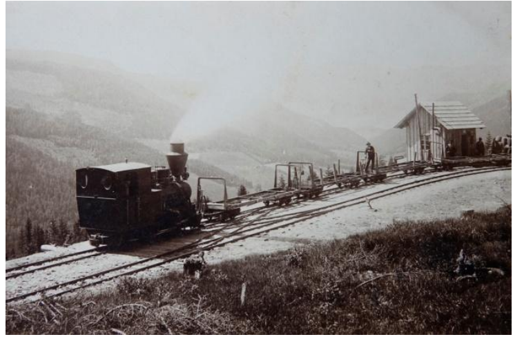
Bremsberg-Bergstation mit der Zobel-Lok, Sattelstrecke

Am Ende der ca. 2,9 km langen Sattelstrecke (ein Abschnitt dieser ehemaligen Trasse ist heute übrigens ein Teil des Wanderweges zwischen dem Feistritzsattel und dem Sonnwendstein) wurden die Waggons über einen Bremsberg mit etwa 821 m Länge ins ca. 234 m tiefer gelegene Fröschnitztal transportiert.