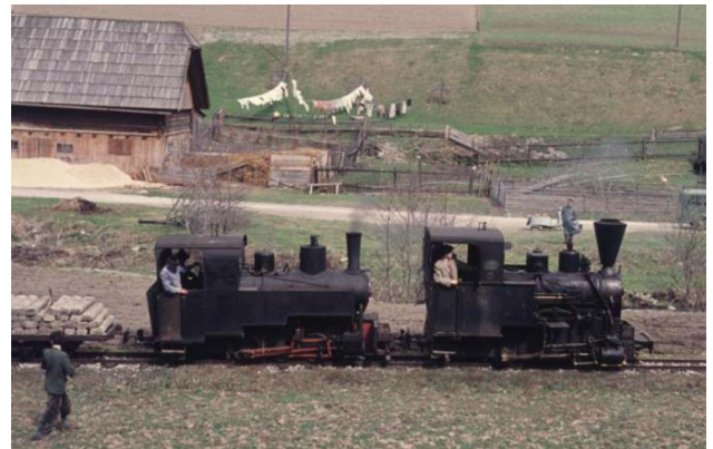
Decauville- und Krauss-Linz-Lok (Baujahr 1930 bzw. 1918), Fröschnitztal

Der Verkehr auf drei Teilstrecken dieser Waldbahn (im Fröschnitztal, auf der Sattelstrecke und im Feistritztal) wurde mit mehreren dreiachsigen Dampflokomotiven abgewickelt. Einige Zeit war noch eine zweiachsige Lok im Einsatz. Auf der Bremsbergstrecke und dem Feistritztaaufzug war kein Lokomotivbetrieb möglich. Die reine Fahrzeit von Retteneegg bis Steinhaus betrug ca. zweieinhalb Stunden, in der Praxis dauerte der Transport über die gesamte Strecke allerdings länger.