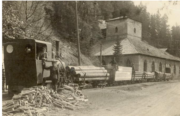
Krauss-Linz-Lok bei der ehemaligen „Alfred-Hütte“, Steinhaus am Semmering