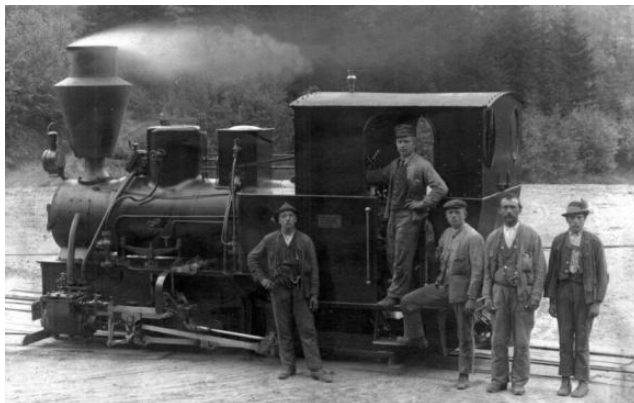
Zobel-Lok (Baujahr 1911), Sattelstrecke