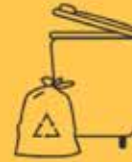
GELBE TONNE & GELBER SACK

Ab 1. Jänner 2025 werden in ganz Österreich alle Verpackungen aus Kunststoff wie Joghurtbecher, Folienverpackungen oder Getränkkartons, gemeinsam mit Metallverpackungen wie Konserven- oder Tierfutterdosen in der Gelben Tonne oder dem Gelben Sack gesammelt. Bepfandete Einweggetränkeverpackungen (Getränkeflaschen und -dosen) gehören nicht in die Sammlung. Informationen zur Rückgabe dieser Gebinde gibt es unter https://www.recycling-pfand.at .