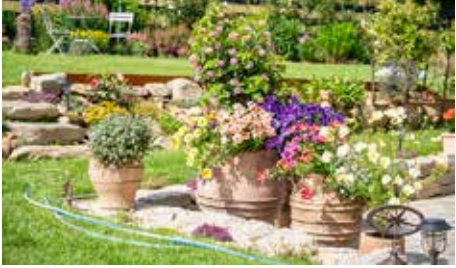
Familie Büttner / Gerberding