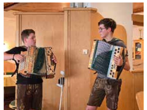
unsere fidelen MUSIKANTEN